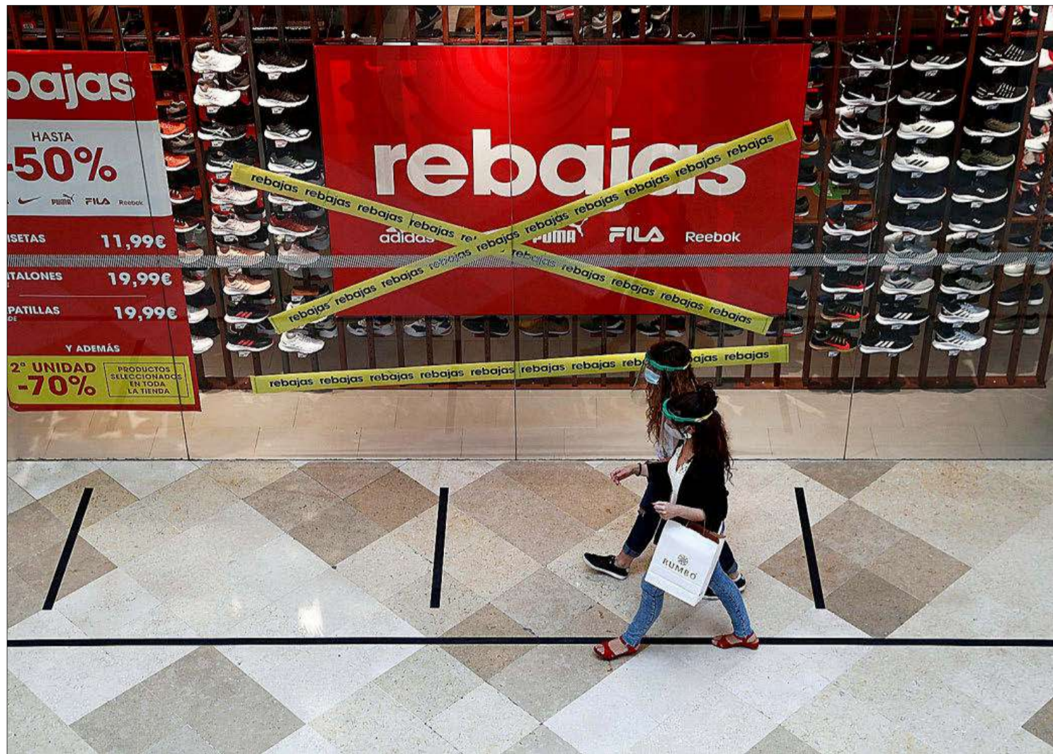
Dos jóvenes pasean frente a la zapatería de un centro comercial en la periferia de Madrid.

El incremento de los concursos de acreedores se produce todavía bajo el escudo aprobado por el Gobierno durante el estado de alarma para evitar una cascada de quiebras de empresas viables afectadas de manera coyuntural por el coronavirus. Estas modificaciones permiten a las propias compañías no comunicar su situación de insolvencia hasta el 31 de diciembre —cuando la Ley fija un plazo de dos meses— y evita que los bancos puedan iniciar de manera forzosa uno de estos procesos para recuperar la deuda. Además, siguen en vigor