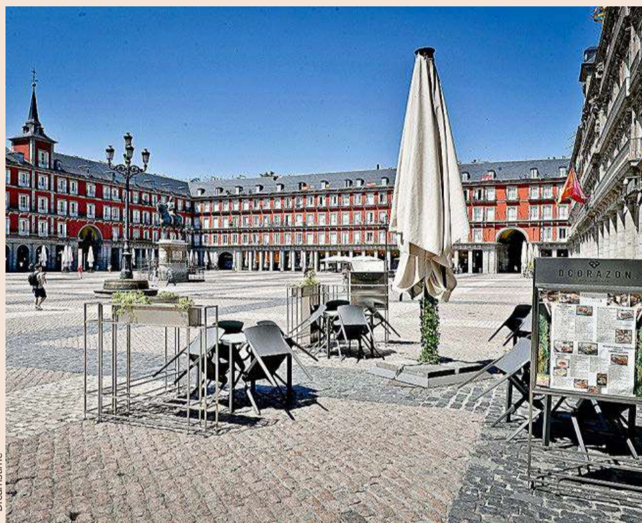
El parón de actividad por las medidas de confinamiento ha provocado pérdidas en miles de empresas.

“Los encuestados piensan mayoritariamente (un 24%) que todas las remuneraciones se verán reducidas desde el Consejo hasta el último empleado”, apunta el informe de la consultora. Para otro 17%,