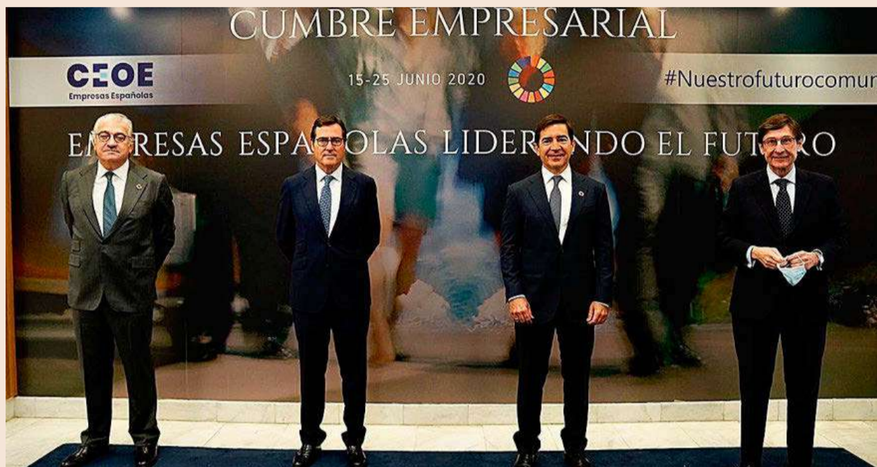
De izquierda a derecha, el consejero delegado de Endesa, José Bogas; el presidente de CEOE, Antonio Garamendi; el presidente de BBVA, Carlos Torres, y el presidente de Bankia, José Ignacio Goirigolzarri, ayer en Madrid.

Y el primero en hacer sus propuestas fue el presidente del Grupo Inditex, Pablo Isla, que reclamó al Gobierno que no derogue la reforma laboral que aprobó el Ejecutivo del PP en 2012, y que no suba los impuestos. Es decir que no lleve a cabo dos de las medidas que están contenidas en el programa electoral del acuerdo PSOE-Podemos. "Es necesario huir de dogmatismos e ideas preconcebidas" en las políticas para salir de la crisis. "Tan importante como las medidas que se tomen es no desmontar lo que está funcio-