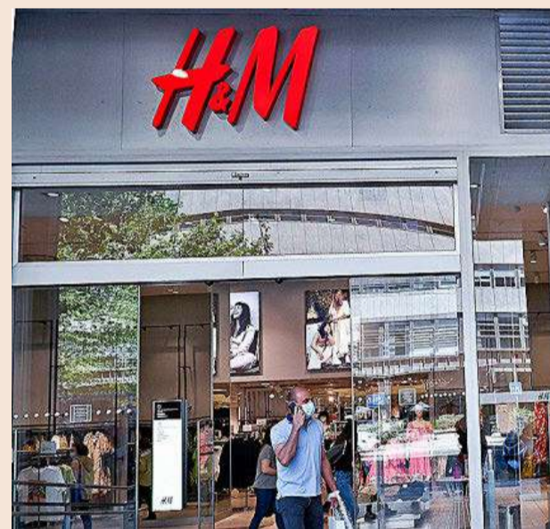
España es uno de los 10 principales mercados para H&M.