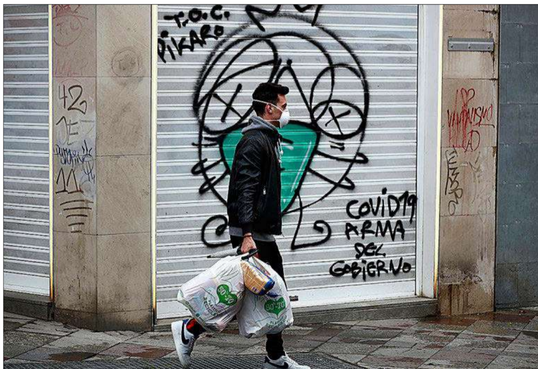
Un hombre pasa frente a un local comercial cerrado en Madrid por el confinamiento.