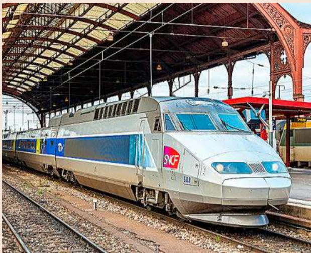
Tren de alta velocidad de SNCF.