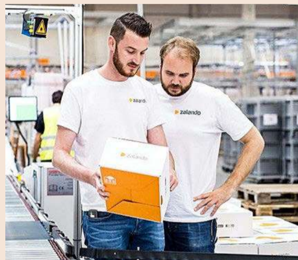
Zalando suma 32 millones de clientes activos en 17 países.

La compañía lanzó Connected Retail en 2016 y ya cuenta con más de 1.800 tiendas conectadas a nivel global a la plataforma, donde se realizan una medida de 41.000 pedidos al