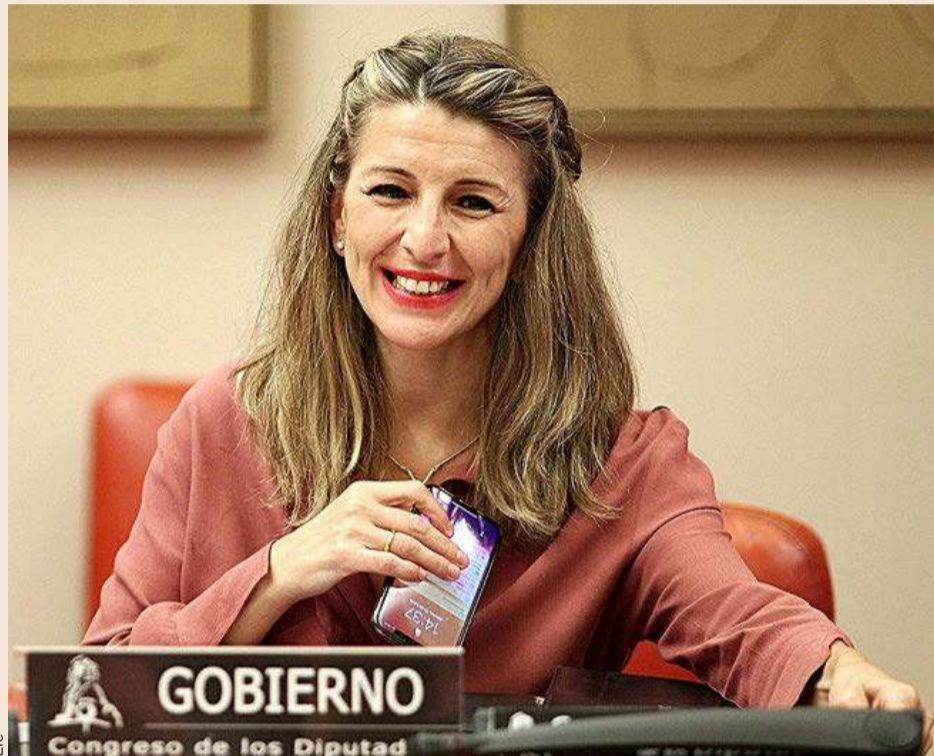
La ministra de Trabajo y Economía Social, Yolanda Díaz, en el Congreso de los Diputados.

La propuesta sobre las exoneraciones de las cotizaciones sociales en los expedientes continúa de la siguiente forma. Respecto a los trabajadores que sigan con el empleo suspendido el 1 de julio, la